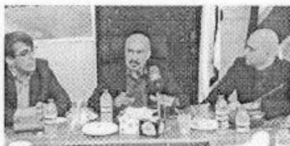
جذب، وارد این دانشگاه می‌شوند.

وی با بیان اینکه براساس ارزیابی‌های انجام شده حدود ۲۵ درصد مدرسینی که در گذشته جذب شده، حذف شدند، اضافه کرد: فراخوان پذیرش مدرس برای سال تحصیلی جدید نیز ۱۰ شه‌بر جاری اعلام خواهد شد.