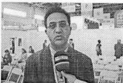
مساله را حداقل برجسته کند.

میرزایی با این وجود طرح مساله و اینکه باور کنیم که دچار مساله هستیم و در کنار ظرفیت های زیاد، چالش های مختلف سیاسی، اقتصادی و اجتماعی جدی هم داریم را چراغی برای آینده عنوان کرد.