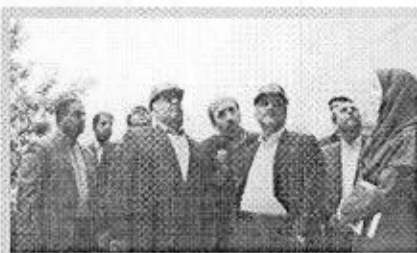
معاون علمی و فناوری رئیس جمهور:

و منظم نسبت به تدوین برنامه اجرایی اقدام کنند. وی درخصوص توازن در برنامه پژوهش و فناوری دانشگاه ها عنوان کرد: برنامه توسعه نوآوری ۵ ساله و برش های یک ساله آن باید از توازن لازم بین برنامه های آینده نگرا و پاسخ گویی به نیازها و چالش های دستگاهی و استانی کشور برخوردار باشد.